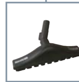
■ RIF. G61 COD. 04845049