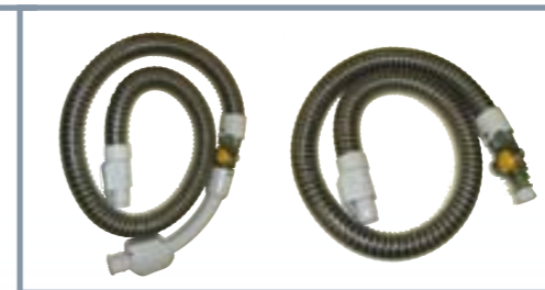
■ RIF. D76 COD. 35600079 ■ RIF. E19 COD. 35600080