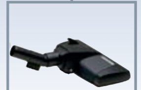
■ RIF. G24 COD. 09595518