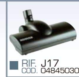
■ RIF. J17 COD. 04845030