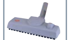
■ RIF. G69 COD. 35600078