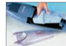
Semplice da rimuovere.