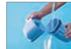
Facile da pulire.