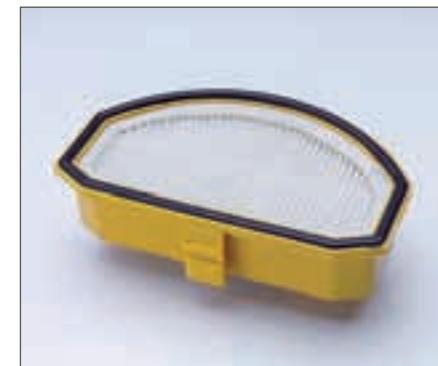
Filtro Hepa lavabile.

I modelli Acenta Pureair sono dotati di sacco carta Purefilt a 3 strati e filtro Hepa lavabile che, combinato con l'azione del filtro "Antibacteria" in uscita, garantisce che solo aria pulita venga rilasciata nell'ambiente circostante.