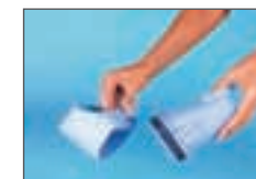
Facile da svuotare.