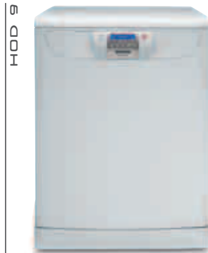
HOD 7 ALU