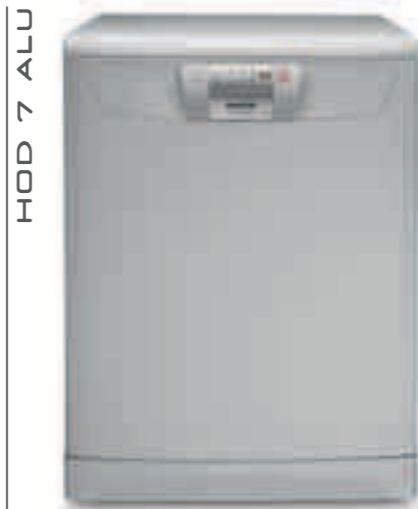
HOD 7 ALU