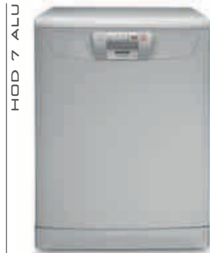
HOD 7 ALU