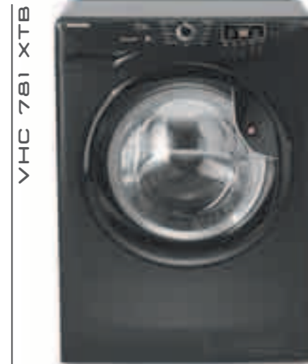
VHC 781 XTB