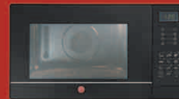
HMC 2592 DBK MICROONDE COMBINATO