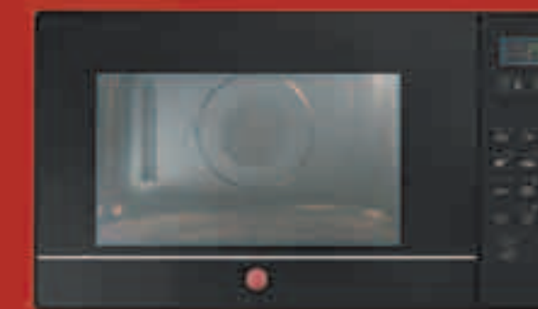
HMG 2591 DBK MICROONDE GRILL

Per garantire i massimi risultati anche per i tipi di cottura che esigono croccantezza e doratura, Hoover presenta un modello di microonde integrato con grill.